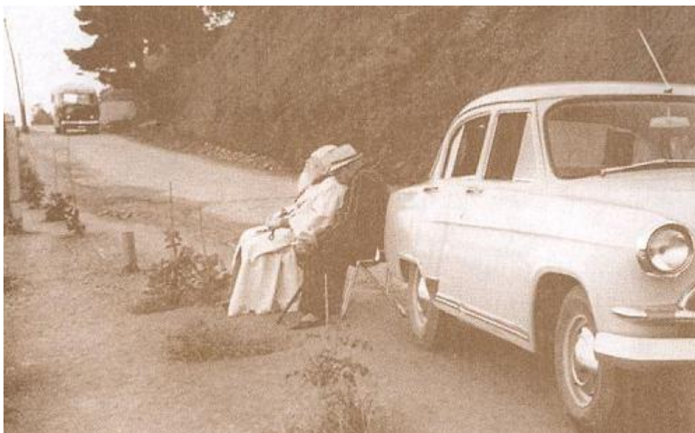
Крымский архиепископ Лука (он же известный хирург Войно-Ясенецкий) и его "Волга" ГАЗ-21 первой серии, конец 50-х.

Первый период жизни владыки Луки действительно, может быть примером для подражания каждому православному христианину. Но второй период его жизни есть период компромисса с советской властью и отречение от себя же самого, от своего исповеднического пути, который прошел до конца другой святитель, открывший ему путь архиерейского служения – новосвященномученик архиепископ Андрей (Ухтомский). Конечно, не я судья архиепископу Луке, но возникает вопрос: может ли быть святым человек, сломавшийся и доносящий на христиан богоборческой власти, и не покаявшийся в этом грехе до самого своего смертного одра?